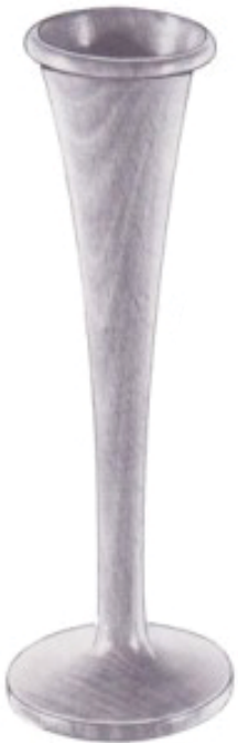
AUS HOLZ OF WOOD DE MADERA EN BOIS IN LEGNO