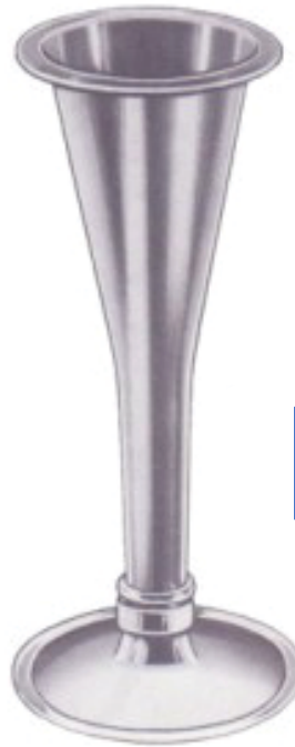
AUS ALUMINIUM OF ALUMINIUM DE ALUMINIO EN ALUMINIUM IN ALLUMINIO